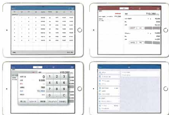
『R POSレジ』のサンプル操作画面

料金プランは、30日間無料でアプリが使える「お試しプラン」と、R POSレジアプリ1つが使用できる月額利用料金5,000円の「スタンダードプラン」、それにPOSレジ+注文アプリ+厨房アプリの3つのアプリが使用できる月額利用料金10,000円の「ビジネスPro」の3つを用意している。顧客のニーズに合わせて料金プランを提案しているとのこ